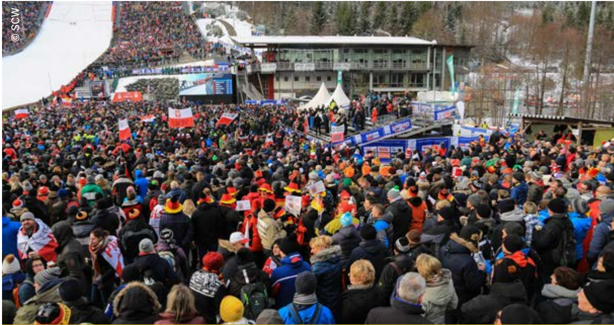
Zuschauermenge beim FIS Skisprung-Weltcup