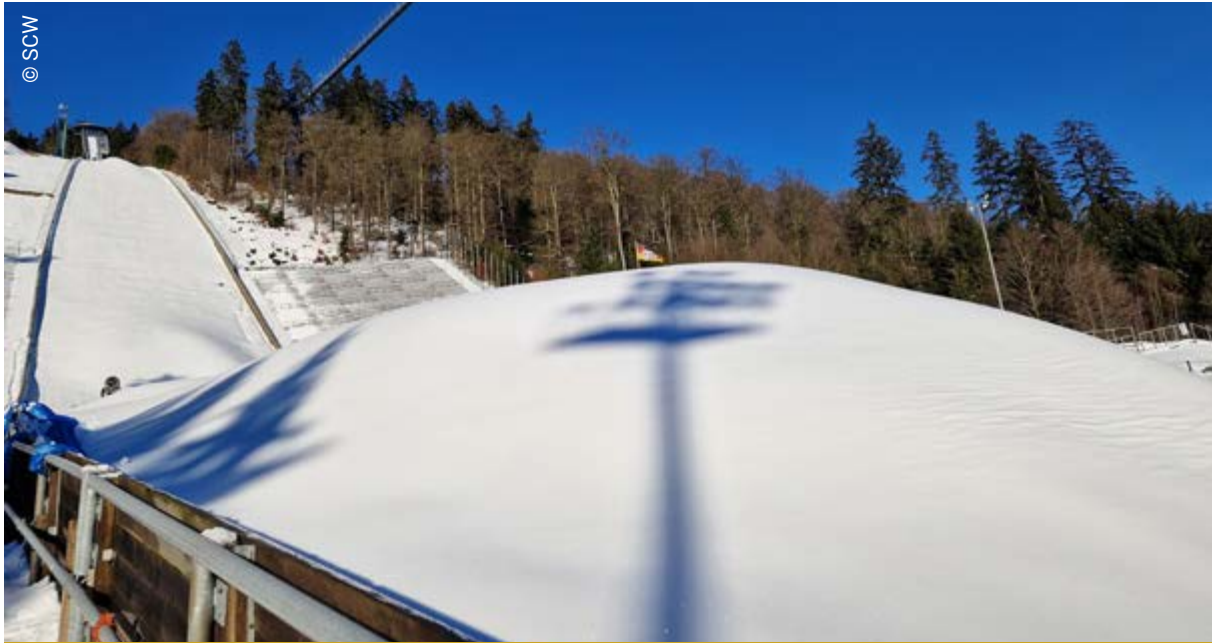
Schneeproduktion für das Wintersportgroßereignis Weltcup