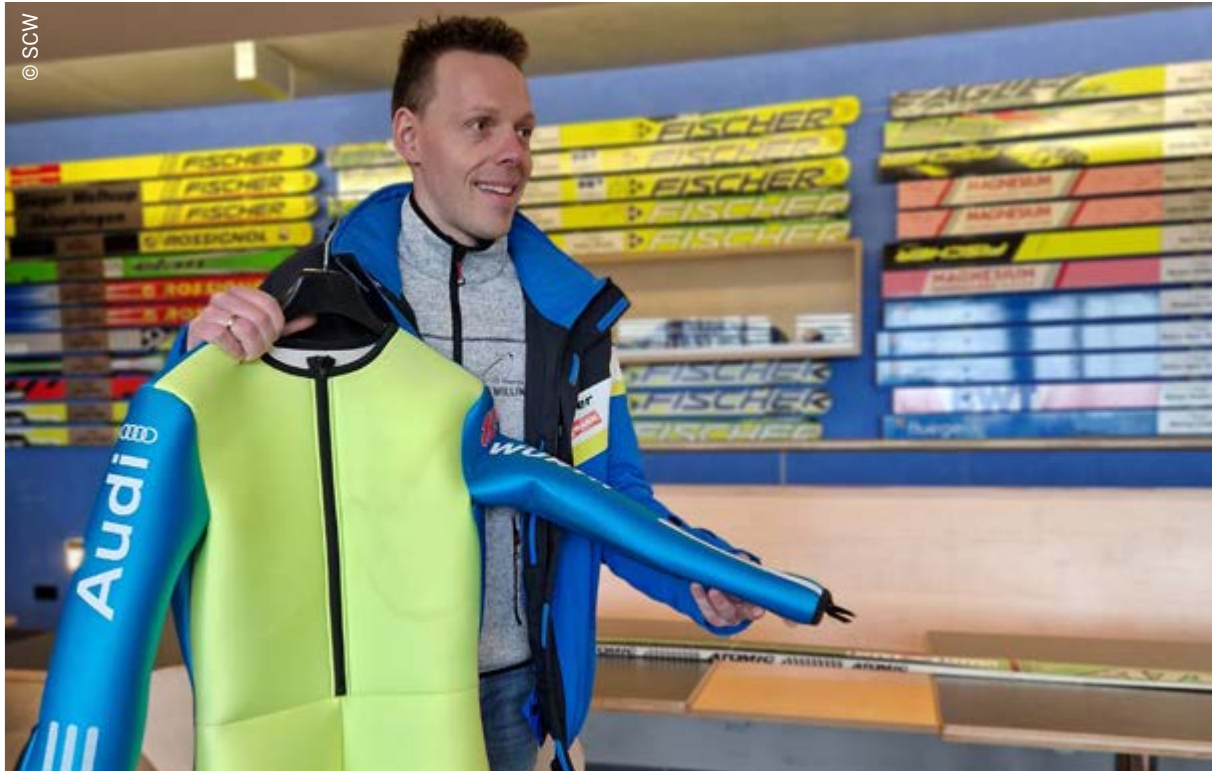
Backstage-Führung beim Weltcup